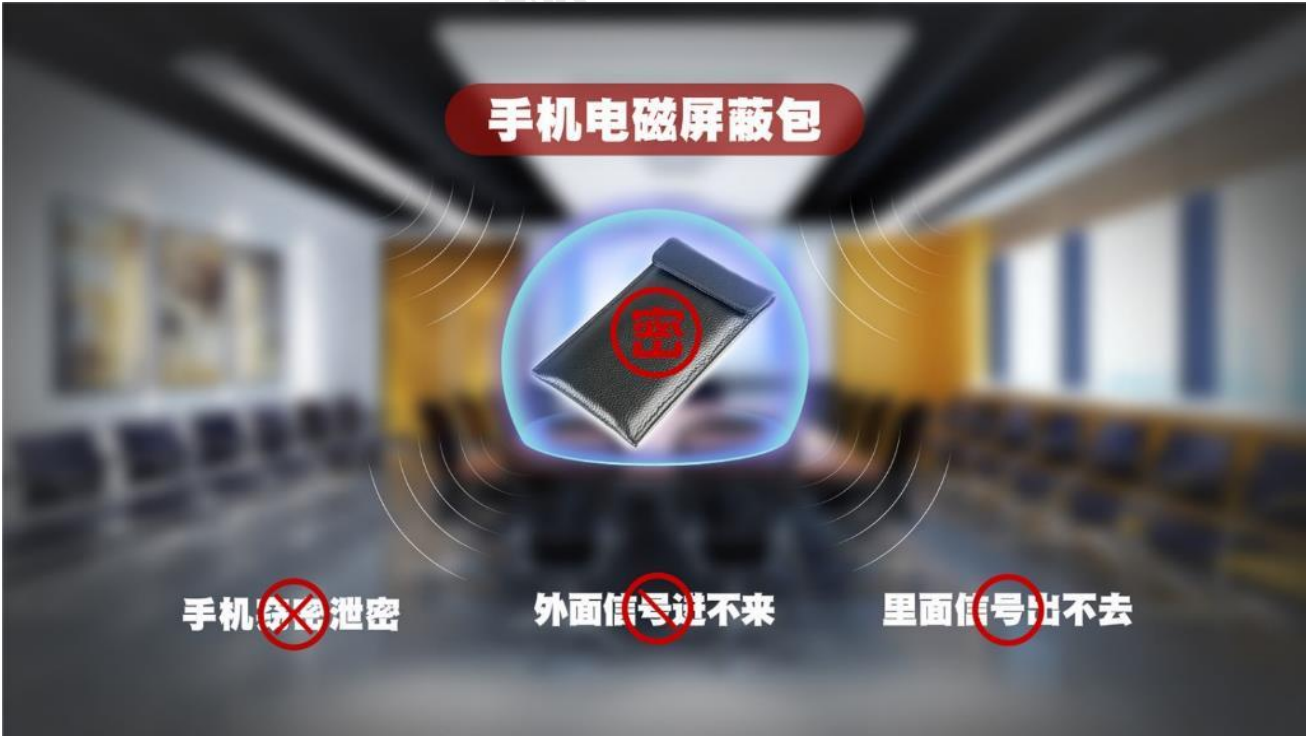
手机电磁屏蔽包/袋