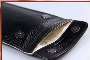
双层屏蔽专利技术