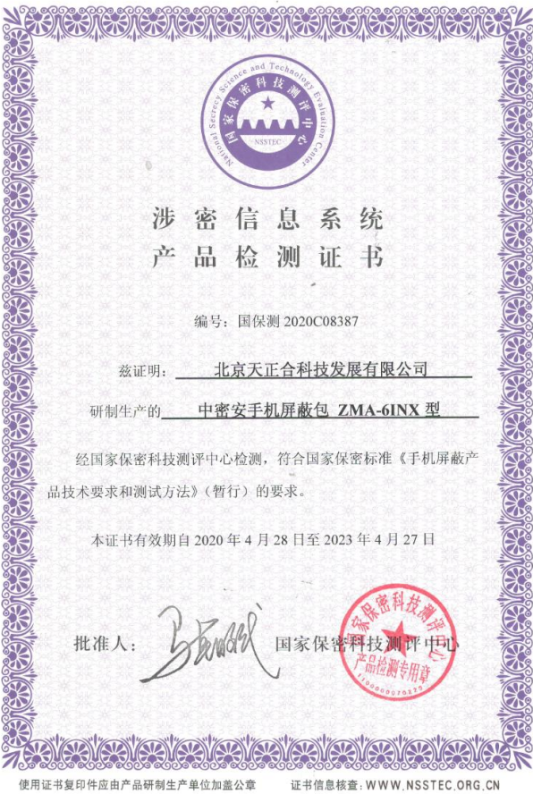
涉密信息系统产品检测证书