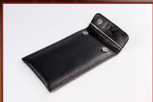
对折闭合防止泄漏