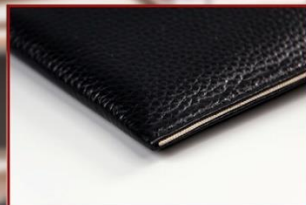
银纤维线四层缝合